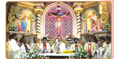
Renovated Parish Church Blessing, Muthupattanam