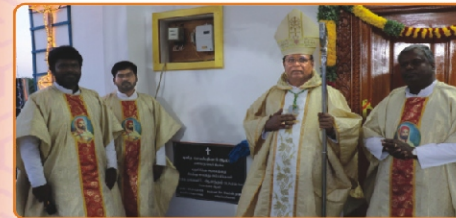
Renovated Church Blessing, Kizhaku Thalir Marungoor