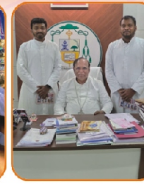
With our Newly Ordained Deacons