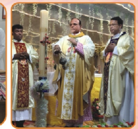
Feast Mass, Pamban