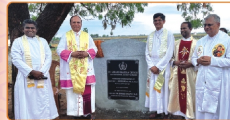
Groundbreaking Ceremony, Anjukottai