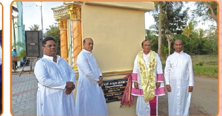
Blessing of the Way of the Cross, Ulaganathapuram