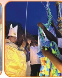
Flag Post Blessing, Marudanthai