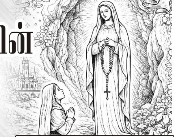
அருள்பணி. லூர்துராஜ் பங்குத்தந்தை, சருகணி

திருச்சபைக் காலத்திலிருந்தே வளர்ந்து வந்த ஆழமான ஆன்மீகப் பாரம்பரியம் ஆகும். இந்த முன்னுரையின் மூலம் அன்னை மரியின் வணக்கத்தின் அர்த்தம், அதன் வரலாற்று வளர்ச்சி மற்றும் கிறிஸ்தவ வாழ்வில் அதன் முக்கியத்துவம் குறித்து சுருக்கமாக அறிந்துக் கொள்ளலாம்.